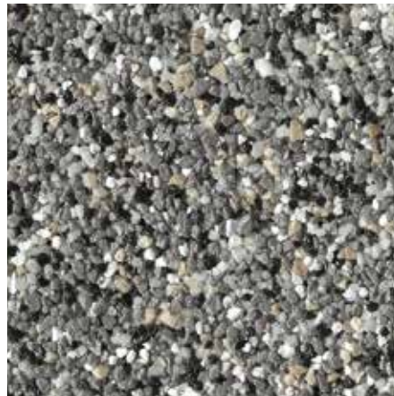
B 413 – Artikel-Nr.: 7113