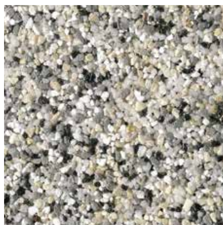
B 824 – Artikel-Nr.: 7116