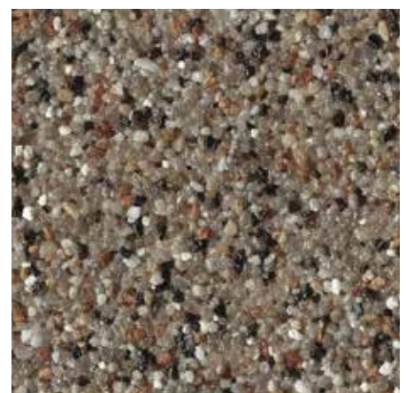
B 831 – Artikel-Nr.: 7117