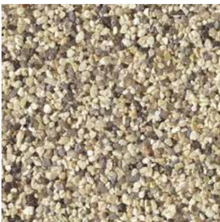
B 820 – Artikel-Nr.: 7115