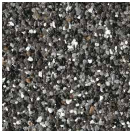
B 834 – Artikel-Nr.: 7119