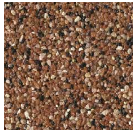
B 836 – Artikel-Nr.: 7120

Die Buntsteinputze von SCHAEFER KRUSEMARK erhalten Sie in der Korngröße 2,0 mm im 23 kg-Eimer. Die Ergiebigkeit liegt bei ca. 5 kg/m 2 . Die Grundierung erfolgt mit QUARZGRUND, eingefärbt im Farbton der Endbeschichtung. Sondertöne gibt es auf Anfrage. Fotobedingte Farbabweichungen der Musterflächen sind möglich. Bitte beachten Sie die Technischen Informationen!