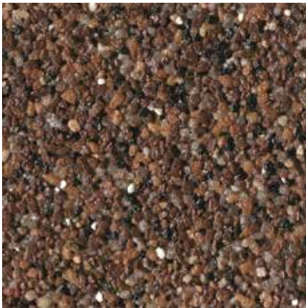
B 405 – Artikel-Nr.: 7112