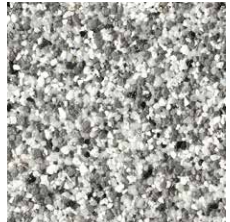
B 818 – Artikel-Nr.: 7114